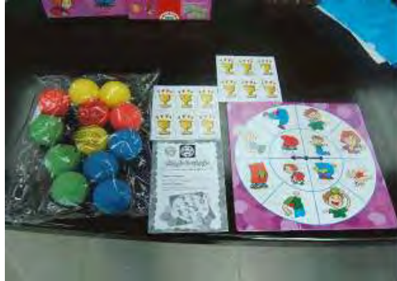
10655 –Wiggle and Giggle (Familia: JC1060 -Competición) (en caja)