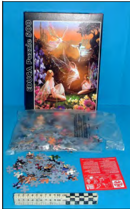
14429 - "500 Baile de hadas" (Familia PA1020)