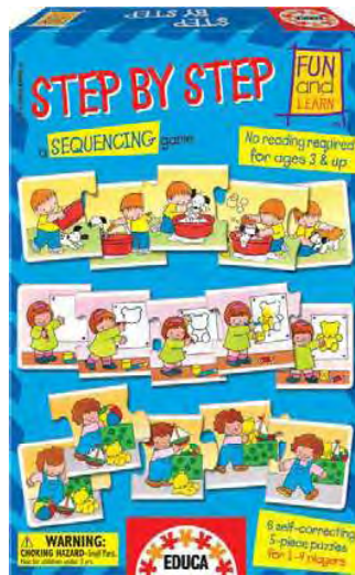
11919 – Step by step