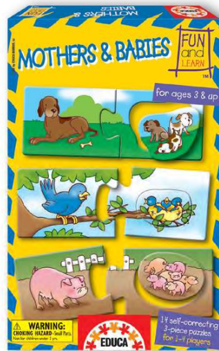
11918 – Mothers &amp; babies