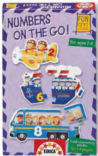
10154 – Numbers on the go!