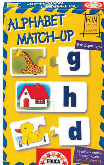
10153 – Alphabet match up