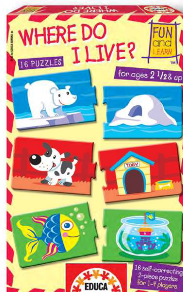
12372 – Where Do I live