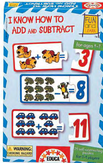
10158 – I know how to add and subtract